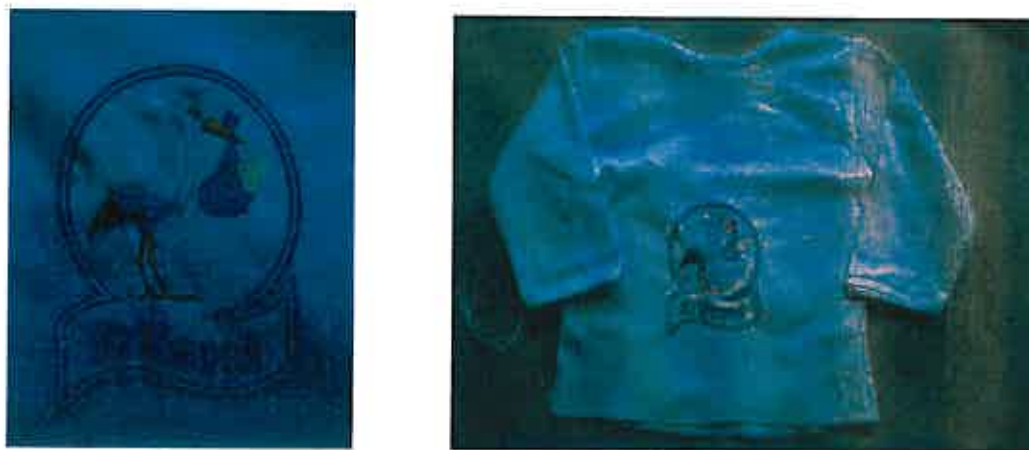
Slika 1. Fotografija benkice s otiskom

Uz novčanu naknadu, roditelje primaju prigodnu čestitku gradonačelnika i simboličan dar – dizajn akademskog kipara.